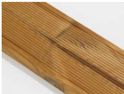
Malé pozdĺžne trhliny na povrchu sú povolené.

Rozmerové tolerancie väd sú špecifikované v samostatnom dokumente „Štandardy dodávok pre exteriérové profily ThermoWood® (materiál - borovica lesná, úprava Thermo-D). Kritéria kvality triedy materiálu „ThermoWood® A“.