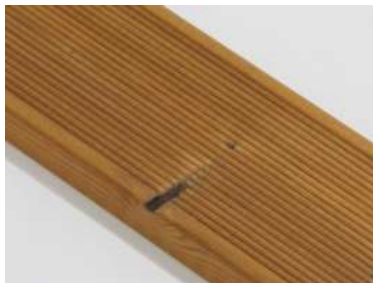
Malý chýbajúci suk je povolený.