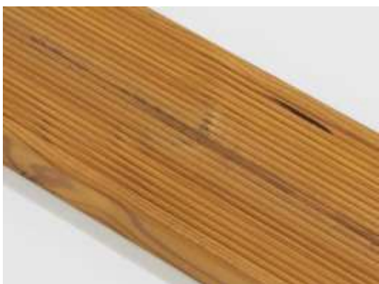
Smolníky sú povolené.