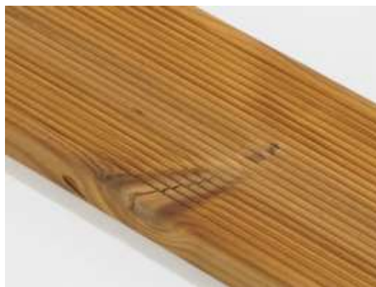
Jedno duchá prasklina suku je povolená.