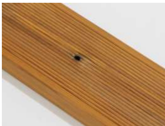
Malá diera po suku (nie skrz) na loske je povolená.