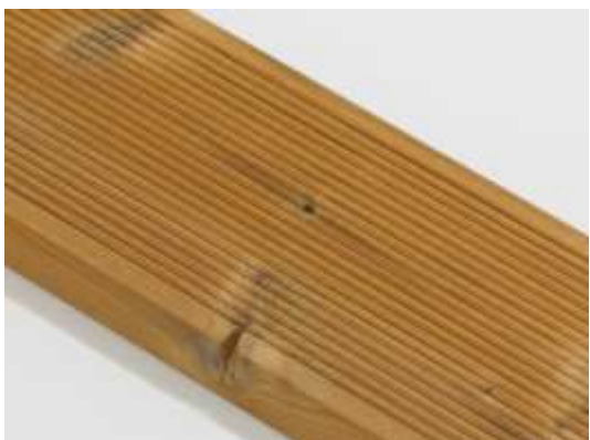
Malá prasklina suku na hrane je povolená.