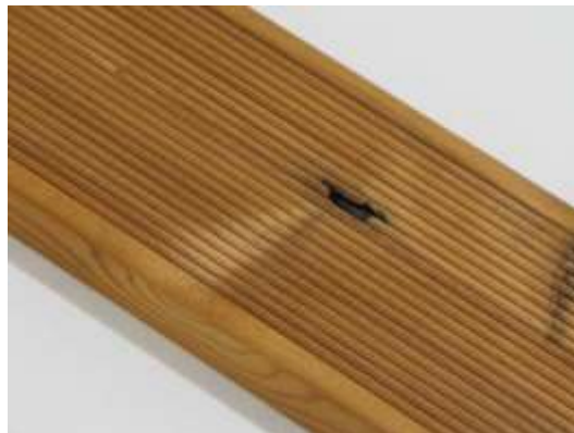
Malé viditeľné vady sú povolené.