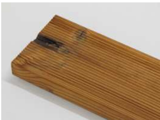
Všeobecne 8 cm od koncov dosiek nie je triedených.